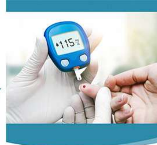
TEMA: ENFERMERÍA MÉDICO-QUIRÚRGICA ATENCIÓN A LA PERSONA CON PROBLEMAS ENDOCRINOS